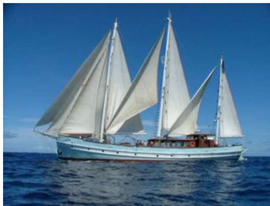
Rara Avis

Elle est partie mi-décembre de l'Aber Wrac'h prête à larguer les 4 flotteurs Apex sur son trajet Canaries-Antilles dans des zones ARGO peuensemencées.