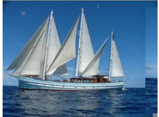
Rara Avis

Elle est partie mi-décembre de l'Aber Wrac'h prête à larguer les 4 flotteurs Apex sur son trajet Canaries-Antilles dans des zones ARGO peuensemencées.